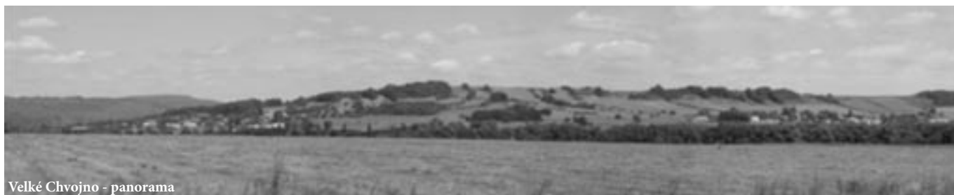
Velké Chvojno - panorama